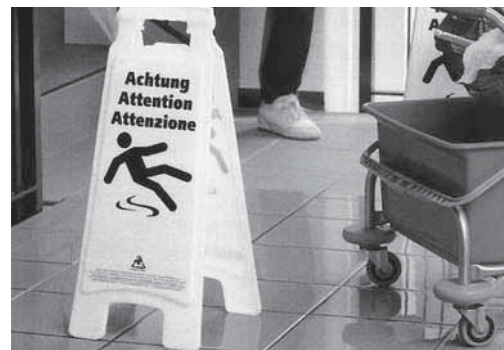
Fig. 5: segnale che indica un pavimento scivoloso. Questo cartello può essere ordinato spesso la Suva (codice 6228).

Consultare anche le seguenti pubblicazioni Opuscolo «Sostanze pericolose – Tutto quello che è necessario sapere» (codice 11030.i), lista di controllo «Protezione della pelle sul posto di lavoro» (codice 67035.i), film «Napò e le sostanze pericolose» (codice DVD 351)