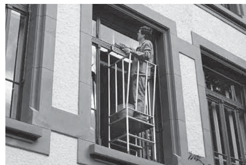
Fig. 6: Parapetto di protezione agganciato tra la finestra e il telaio.

Consultare anche le liste di controllo «Utensili elettrici portatili» (codice 67092.i), «Elettricità sui cantieri» (codice 67081.i) e «Pavimenti» (codice 67012.i)