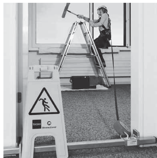
Fig. 7: pulizia delle finestre. La persona è munita di un dispositivo anticaduta di tipo retrattile. L'apparecchio è fissato ad una traversa agganciata al telaio della porta.