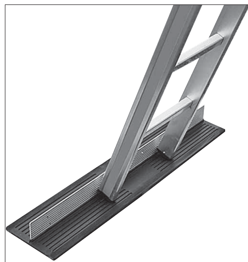
Fig. 2: con una base adeguata (ad es. tappetino antiscivolo) si impedisce che i piedi della scala scivolino.