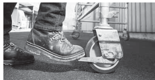
Fig. 4: prima di salire bloccare i freni delle ruote.

Consultare anche la lista di controllo «Ponteggi mobili su ruote» (codice 67150.i)