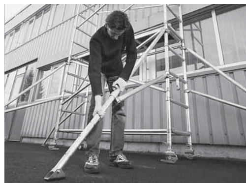
Fig. 3: dispositivo per evitare il ribaltamento del ponteggio mobile.