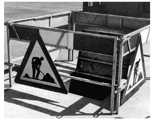
Figura 4: sbarramento di uno scavo; i pericoli che derivano dallo svolgimento dei lavori presso il cliente devono essere minimizzati in collaborazione con quest'ultimo.