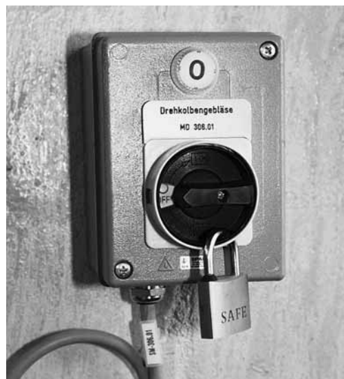
Figura 3: interruttore di sicurezza in posizione 0, bloccato con un lucchetto contro il reinserimento.