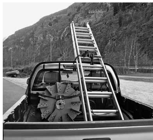
Figura 2: fissaggio del carico sul veicolo.