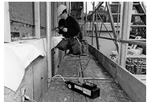
Figura 5: in mancanza di un distributore di corrente per cantieri utilizzare l'interruttore FI (salvavita).

Prima di iniziare i lavori, i collaboratori si informano presso il cliente sull'ubicazione delle seguenti strutture di emergenza?