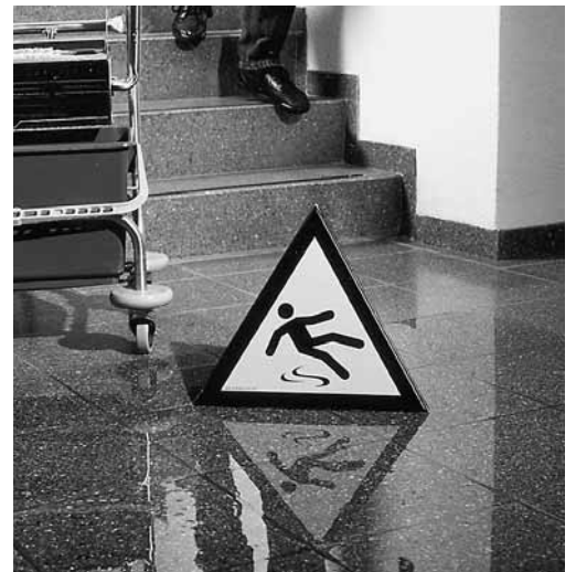
Figura 7: le zone scivolose, soprattutto dopo la pulizia, e gli ostacoli presenti temporaneamente sul pavimento (cavi, tubi, ecc.) devono essere adeguatamente segnalati o delimitati.