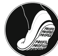
Figura 8: segnale di sicurezza «Portare scarpe provviste di soles antisdrucciolevoli» (codice Suva 1729/63).

Potete trovare ulteriori informazioni e suggerimenti su questo argomento nelle seguenti pubblicazioni: