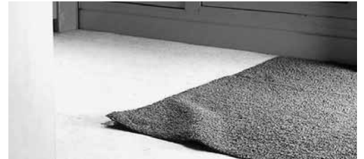
Figura 5: i bordi rivolti all'insù dei tappeti devono essere fissati con fascette idonee.