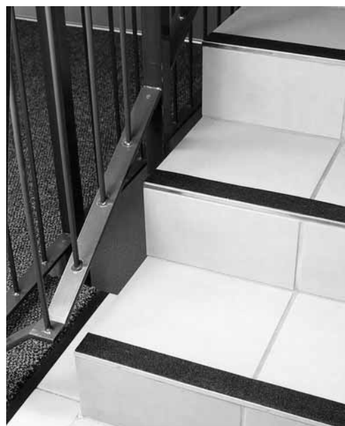
Figura 2: strisce antiscivolo applicate su scalini lisci.