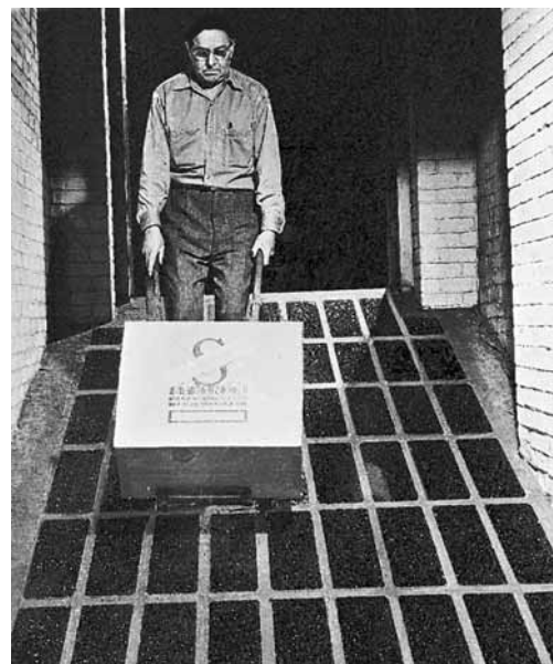
Figura 1: rampa di accesso con rivestimento antiscivolo.