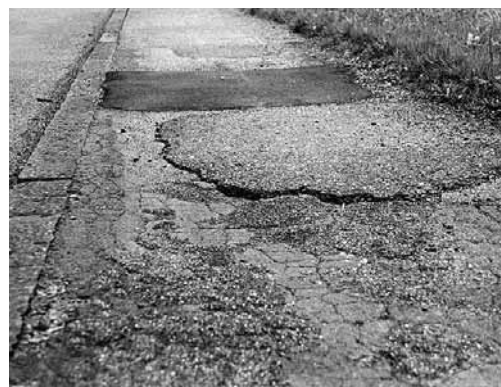
Figura 3: rivestimento riparato malamente; i dislivelli devono essere ridotti al minimo.